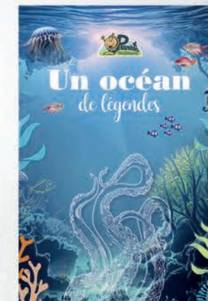
Un océan de légendes